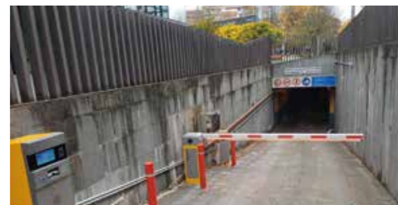
Entrada al parking, con lectura de matrícula y ticket de entrada.