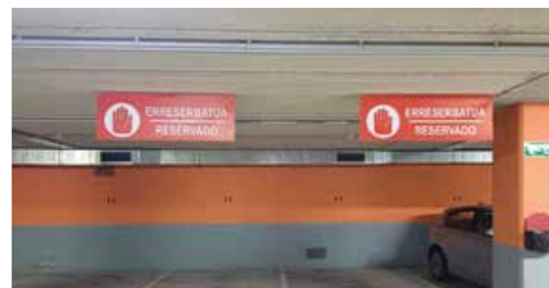
Plazas de uso reservadas, NO rotatorias.