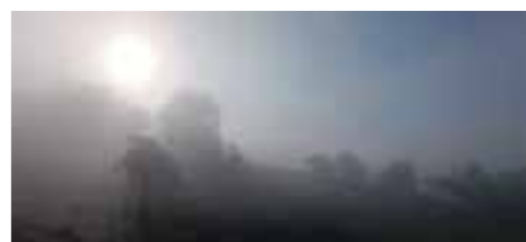
BELAINOA Egilea: Ion Ander Garcia

Esta vez riachuelos no, pero sí las ramblas, la niebla y las vacas de Etxano, fotografías ganadoras del concurso y que amablemente nos han cedido para ilustrar estas palabras que tan a menudo usamos y que tanto significan para nuestro equipo de Kantarranas.