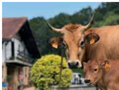
ERROTAURRE Egilea: Aitor Etxebarria