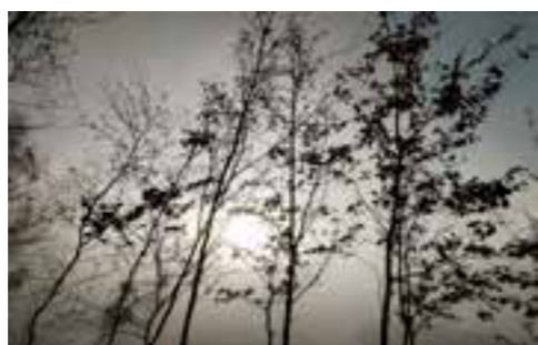
LAINOAK Egilea: Rafa Zurinaga

“Este mes, vaquitas y riachuelos”, esta es la frase, y la usamos cuando creemos que no llegamos y que tendremos que poner una imagen con vacas y riachuelos para llenar un hueco porque el artículo o las imágenes no llegan a tiempo. Y va más allá esta frase. Tiene mucho que ver con no presionar a las personas a la hora de hacer su trabajo. Con no meter prisa. Con no culpar ni agobiar. Si alguien no llega, es porque no ha podido llegar. Siempre queremos llegar, pero a veces no podemos. Nadie quiere no hacer su trabajo en esta asociación. Todo el mundo quiere hacer mucho y más. Porque su trabajo es aportar un granito de arena por y para las personas con alguna discapacidad. Esa es la motivación, la ilusión y el motor de todo lo que hacemos. Y por eso llegamos siempre.