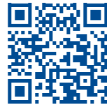
// LURRALDEA · TERRITORIO