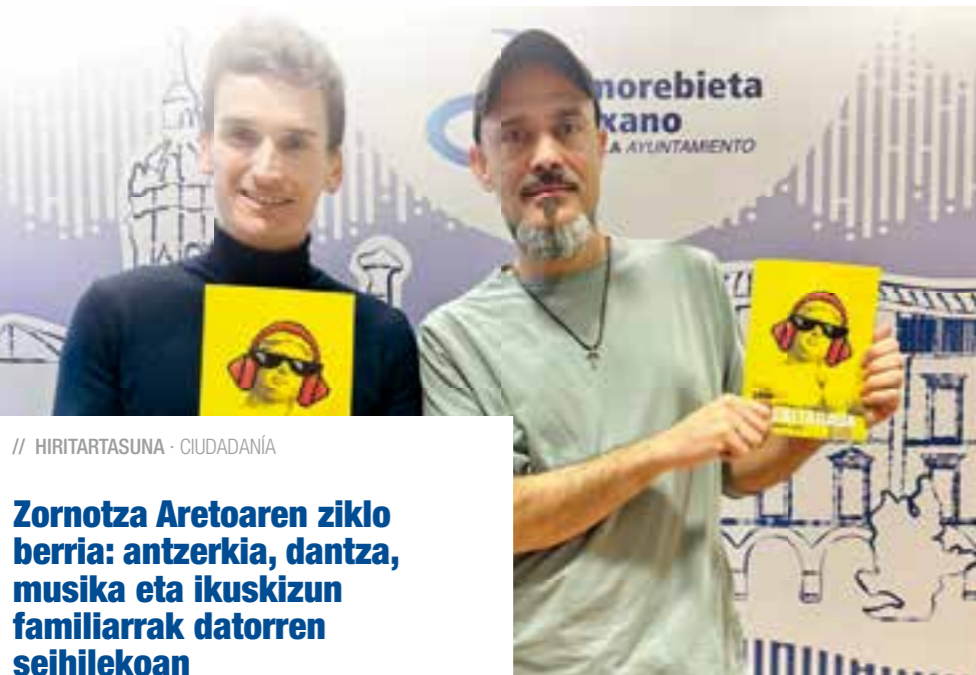
// HIRITARTASUNA · CIUDADANÍA