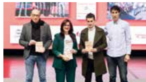
// HIRITARTASUNA · CIUDADANÍA