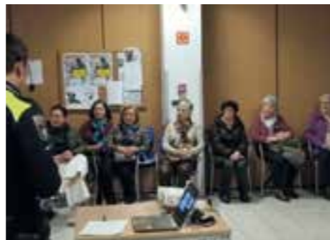
// HIRITARTASUNA · CIUDADANÍA

Se trata del itinerario peatonal que conectará los barrios de Zubikurtze, Zubipunte y Zubizabala, ubicados en el corazón de la localidad zornotzarra: “comprometidos con el desarrollo sostenible y la Agenda 2030, esta iniciativa permitirá expandir nuestro entorno verde alrededor de los barrios y facilitará la movilidad peatonal de las y los residentes de