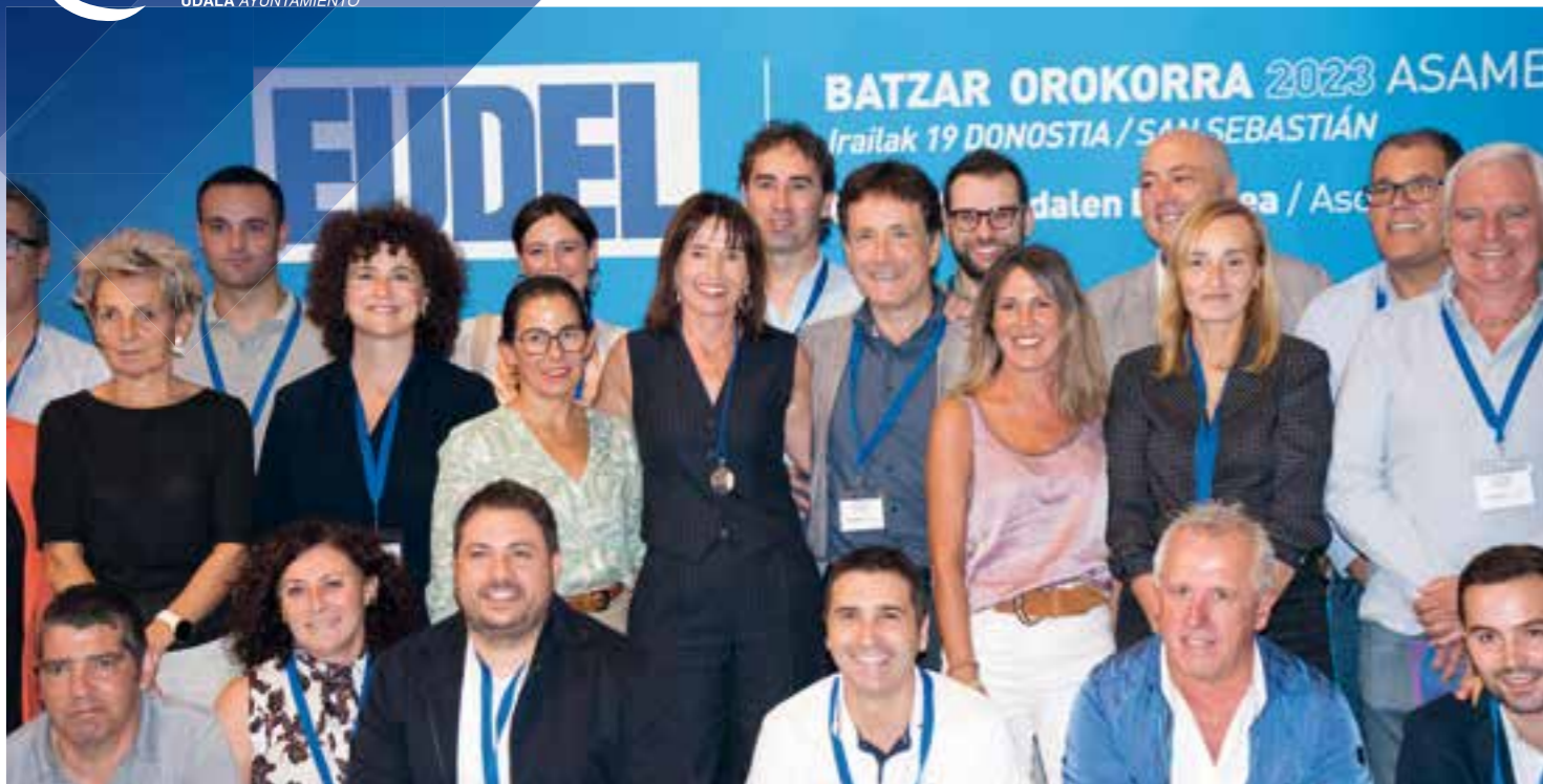
// HIRITARTASUNA · CIUDADANÍA