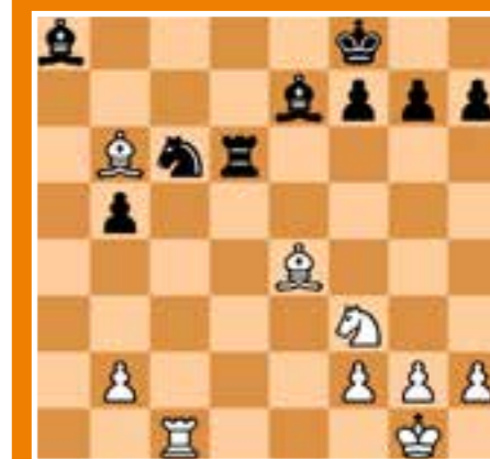
Problema de Octubre

Para terminar, nos gustaría invitar a todos los niños y niñas que estén interesados en tomar clases de ajedrez, que pasen por el Zelaia los martes a partir de las 17:15 para informarse.