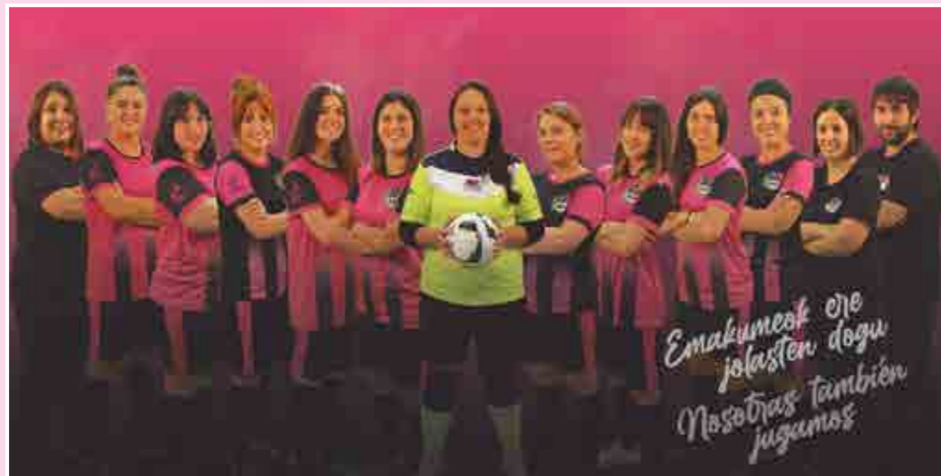
Betigol, el club deportivo de fútbol sala femenino de Amorebieta,

Comienza una nueva etapa, en la que no habrá partidos, ligas o copas, pero este equipo no parará y si puede seguir entrenando, enseñando, jugando, ... será suficiente. Ya llegarán tiempos mejores para poder competir, y empatar, perder o ganar partidos. Lo importante, y lo sabemos, es no perder las ganas ni la ilusión por este deporte.