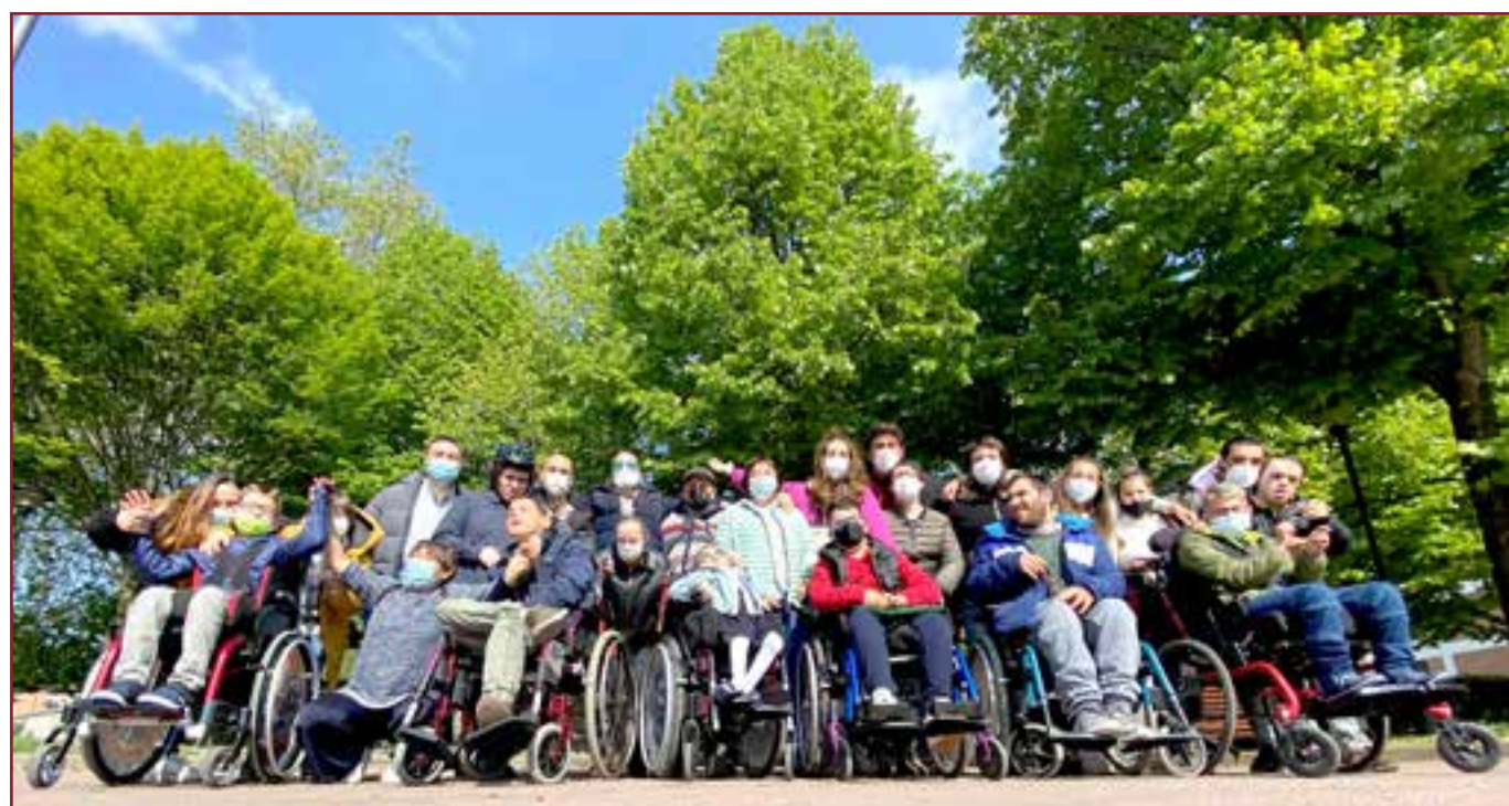
La familia crece. De todas las edades, sabores y colores en A.I.D.A.E.

Estamos hablando de las monitoras y monitores que cuidan, entretienen, acompañan, y crecen junto a las chicas y chicos que disfrutan de los diferentes programas.